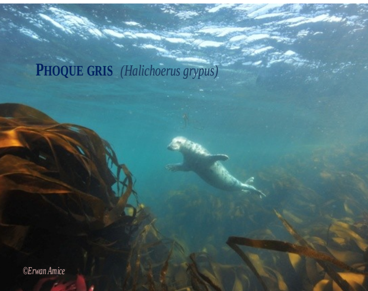
PHOQUE GRIS ( Halichoerus grypus )

En suivant une procédure très stricte dictée par le guide, l'évolution d'un ou plusieurs phoques sous la surface est régulièrement observable.